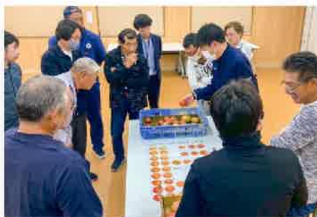
目ぞろえをする参加者ら

JAトマト専門部は4月20日、JA南部営農経済センターで春作型生産者を対象に中間検討会を開きました。