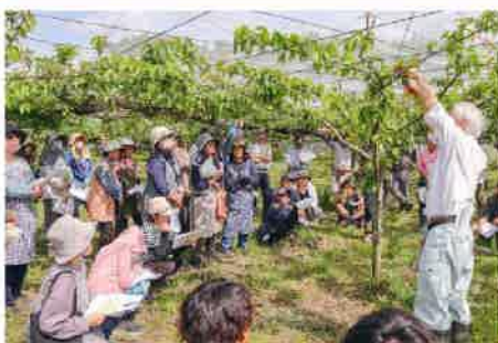
摘果の留意点を確認する参加者ら

JA梨専門部は5月7、8日の2日間、宇都宮市内で4支部ごとに摘果講習会を開きました。県河内農業振興事務所の担当者は生育状況について、「4月上旬に降霜があったものの、現時点で大きな被害は確認されていない」と説明。本年の開花盛りは前年より6～10日、平年より1～5日早かったと報告しました。