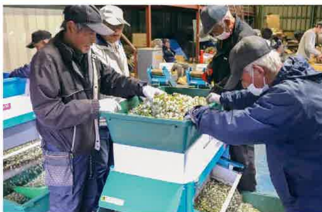
花弁や不純物を取り除く支部員ら

JA梨専門部清原支部は4月9日、JA竹下農業倉庫で2026・27年産梨の交配に使用する花粉の採取を行いました。支部員約30人が集まり、支部で共同管理する花粉樹園約25アールなどから、「長十郎」や「豊水」を中心に、複数の花やつぼみを持ち込みました。同支部は、火傷病の影響で花粉確保が難しくなる以前から、安定確保を目的として自家採取による花粉確保に取り組んできました。