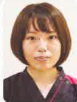
上都賀総合病院 健康管理センター 保健師