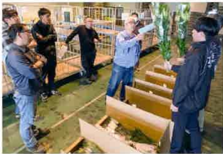
目ぞろえをする参加者ら

JA球根切花専門部は4月28日、JA東部選果場花き集荷場でユリの目ぞろえ会を開きました。参加者が、梱包されたユリを1束ずつ掲げ、つぼみの大きさや締まり具合、色付き、切り前などを入念に確認しました。