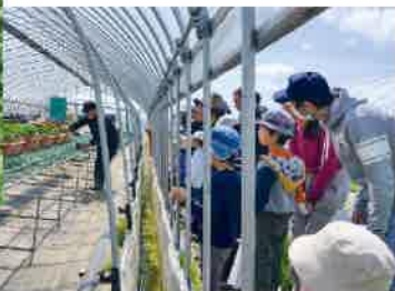
苗の説明を受ける参加者