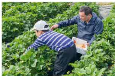
イチゴの収穫を楽しむ参加者

当JA管内の農事組合法人石那田ファームは、作業効率化を図るため、ドローンを活用した水稲の「たん水直播」を実施しました。当JAでも、先端技術を活用した「スマート農業」の普及拡大と定着に取り組んでいます。