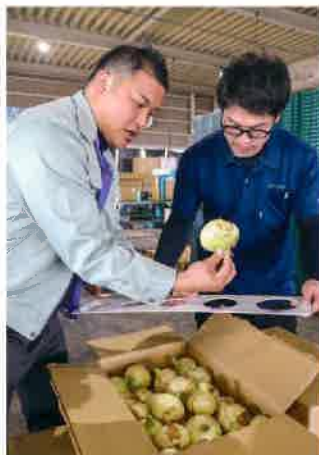
タマネギを確認するJAの担当者