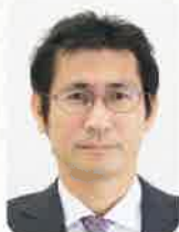
ウチノ税理士法人 税理士