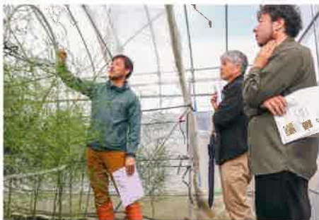
夏に向けて現地で検討をする参加者

JAグリーンアスパラガス専門部は4月23日、宇都宮市内の生産者ファームで現地検討会を開き、夏に向けた立茎の管理方法などを確認しました。