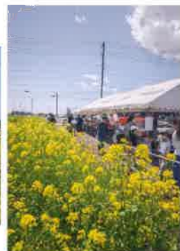
横川地区の「なの花まつり」