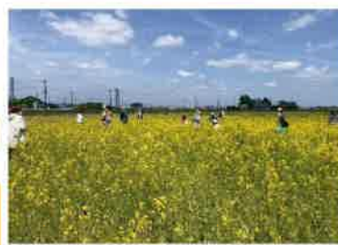
雀宮地区の「なの花まつり」