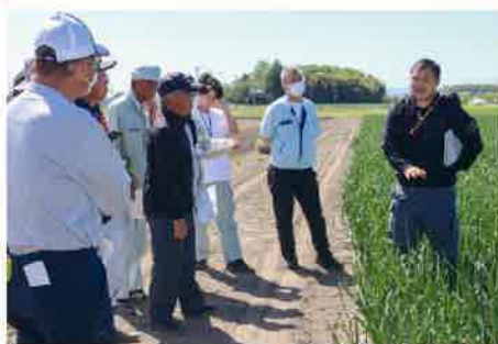
現地検討をする参加者ら

JA玉葱専門部宇都宮支部は4月21日、宇都宮市内の生産者ほ場で現地検討会を開き、2026年産タマネギの生育状況や今後の栽培管理、収穫時期について意見交換をしました。